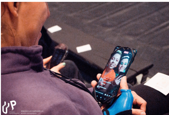
Présentation de fin de résidence, mars 2022, UP-Circus & Performing Arts